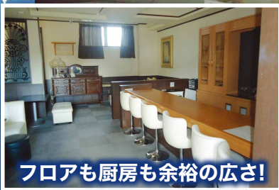
フロアも厨房も余裕の広さ!

月額家賃 121,000円 占有面積/15.45坪(51.09㎡) (消費税・共益費)込み