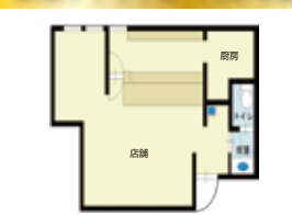
新築テナントB 102号室