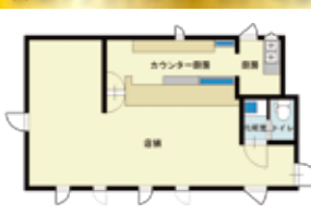
新築テナントA(仮称) 201号室